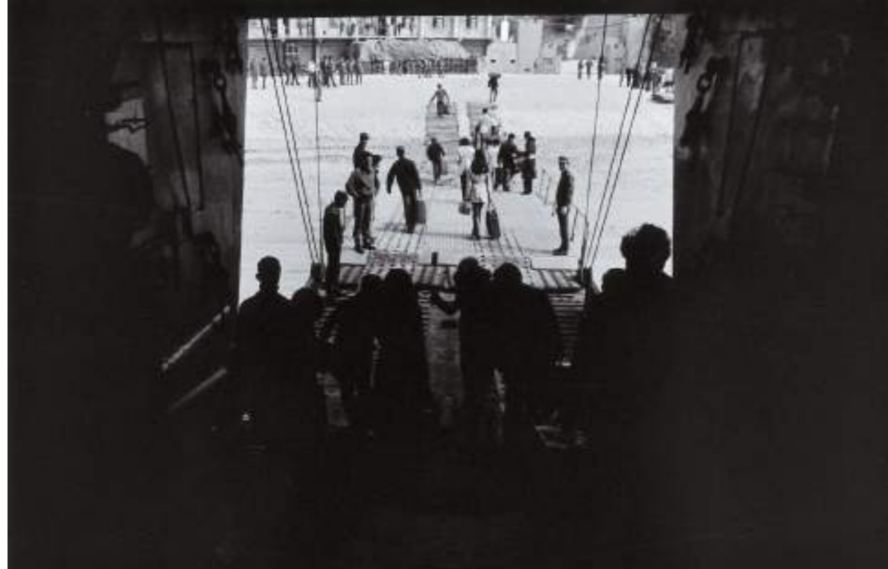
(上) 從運補船看到的馬祖第一眼。馬港