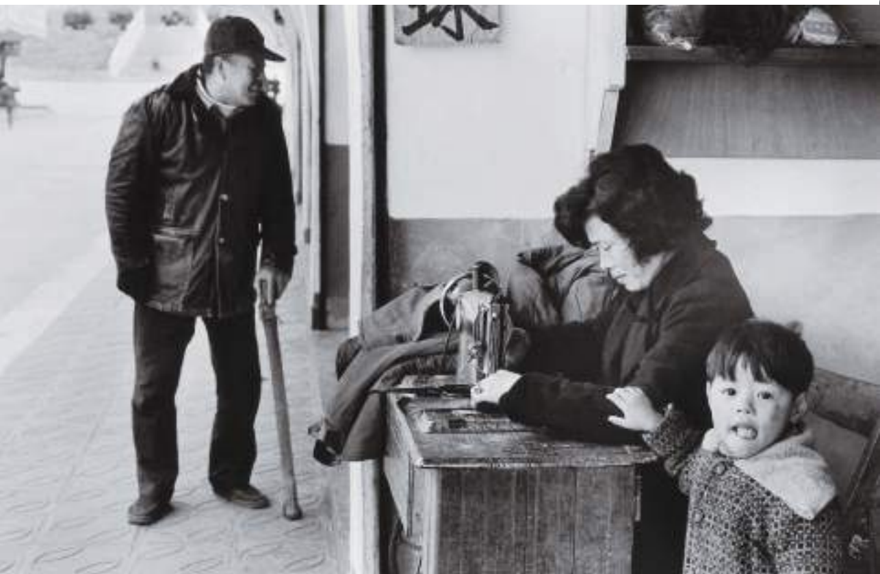
(下) 縫製軍服是大多數婦女的家庭副業。馬港