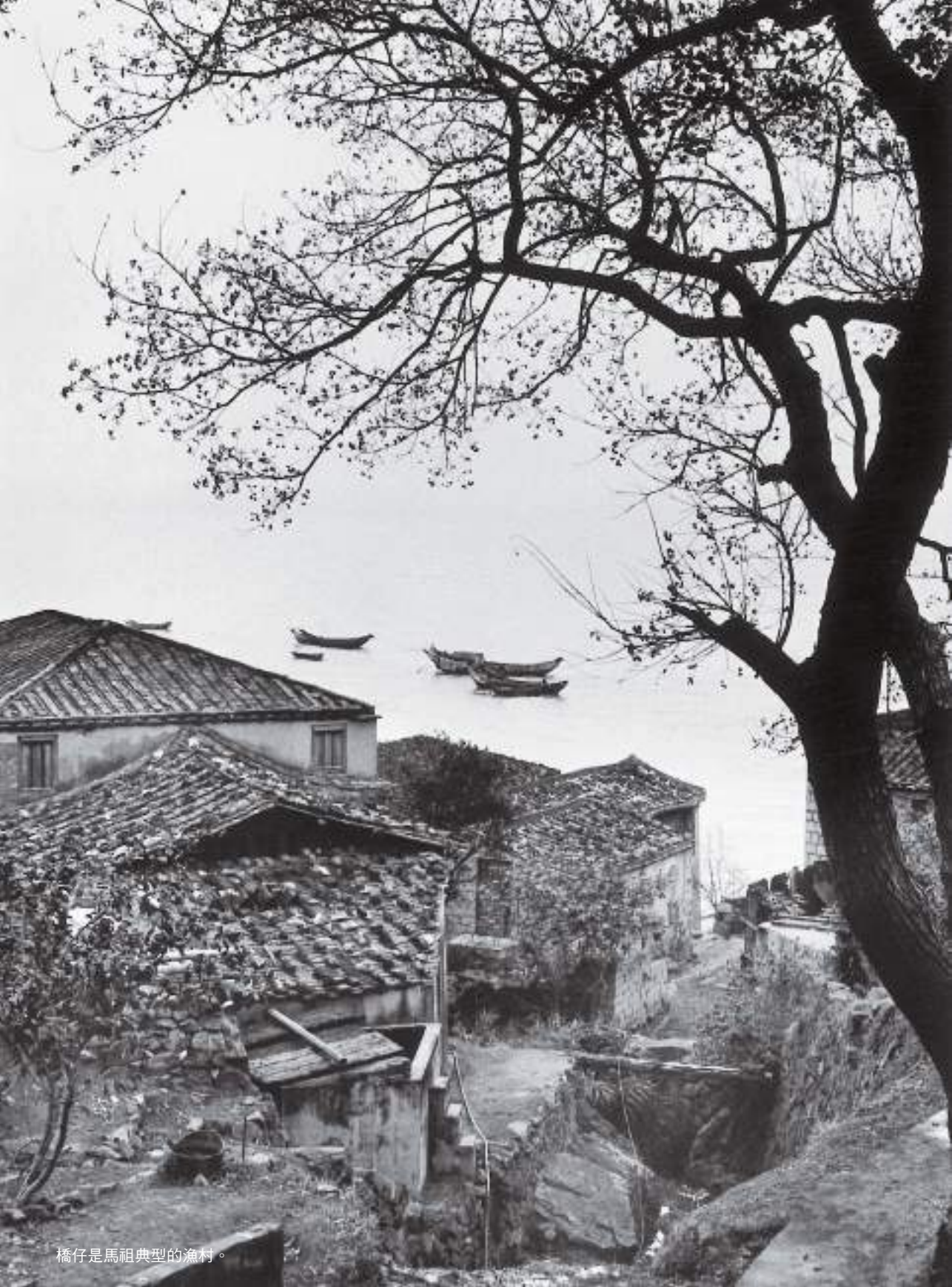
橋仔是馬祖典型的漁村。