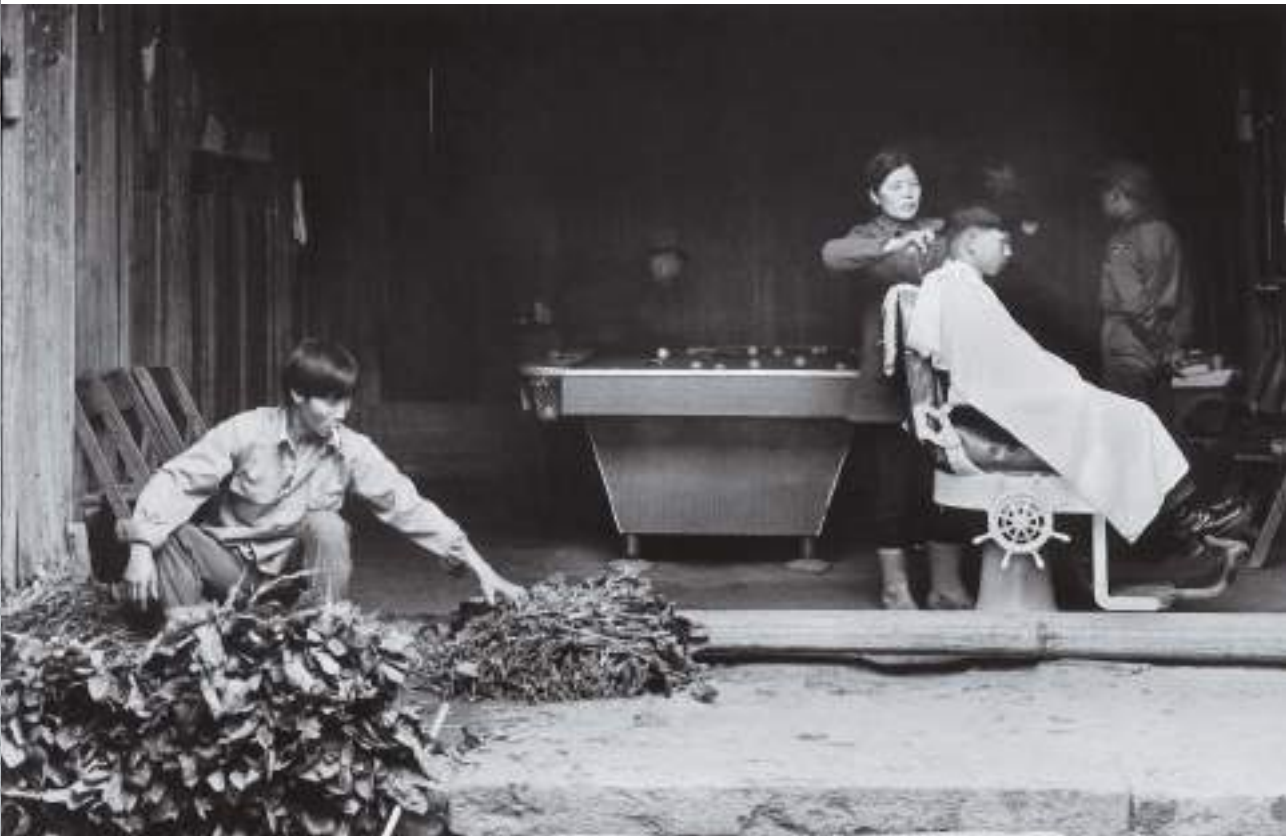
(下) 當年的坂里大宅有理髮座、撞球台。坂里