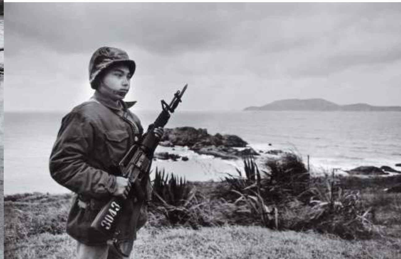
(下) 東莒守衛戰士。大浦