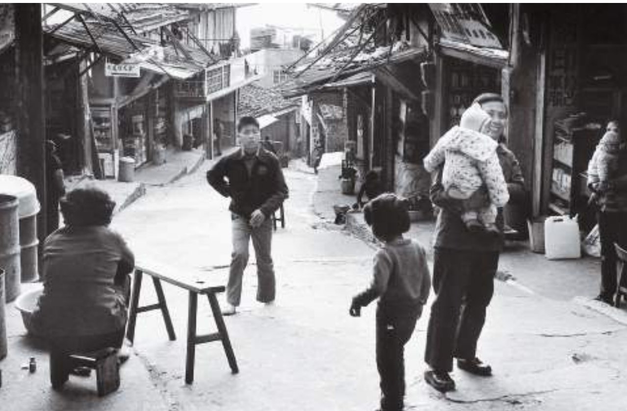
(下) 街道巷弄是家的延伸。鐵板