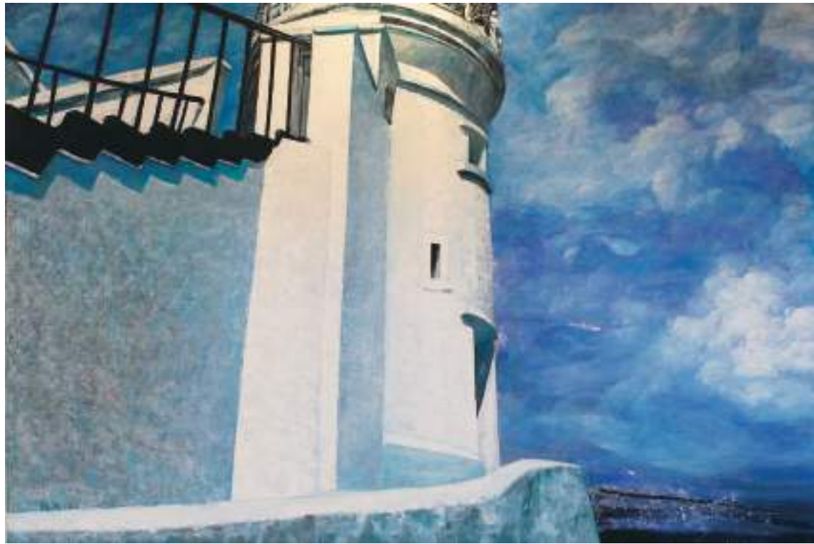
(上) 白色東引燈塔，油彩，194×130.5cm，2012