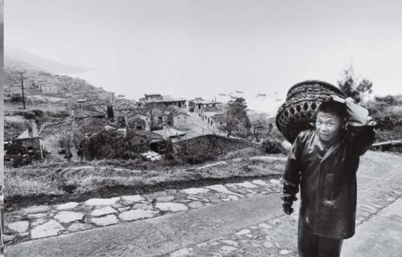
(上) 剛上岸的漁民。橋仔