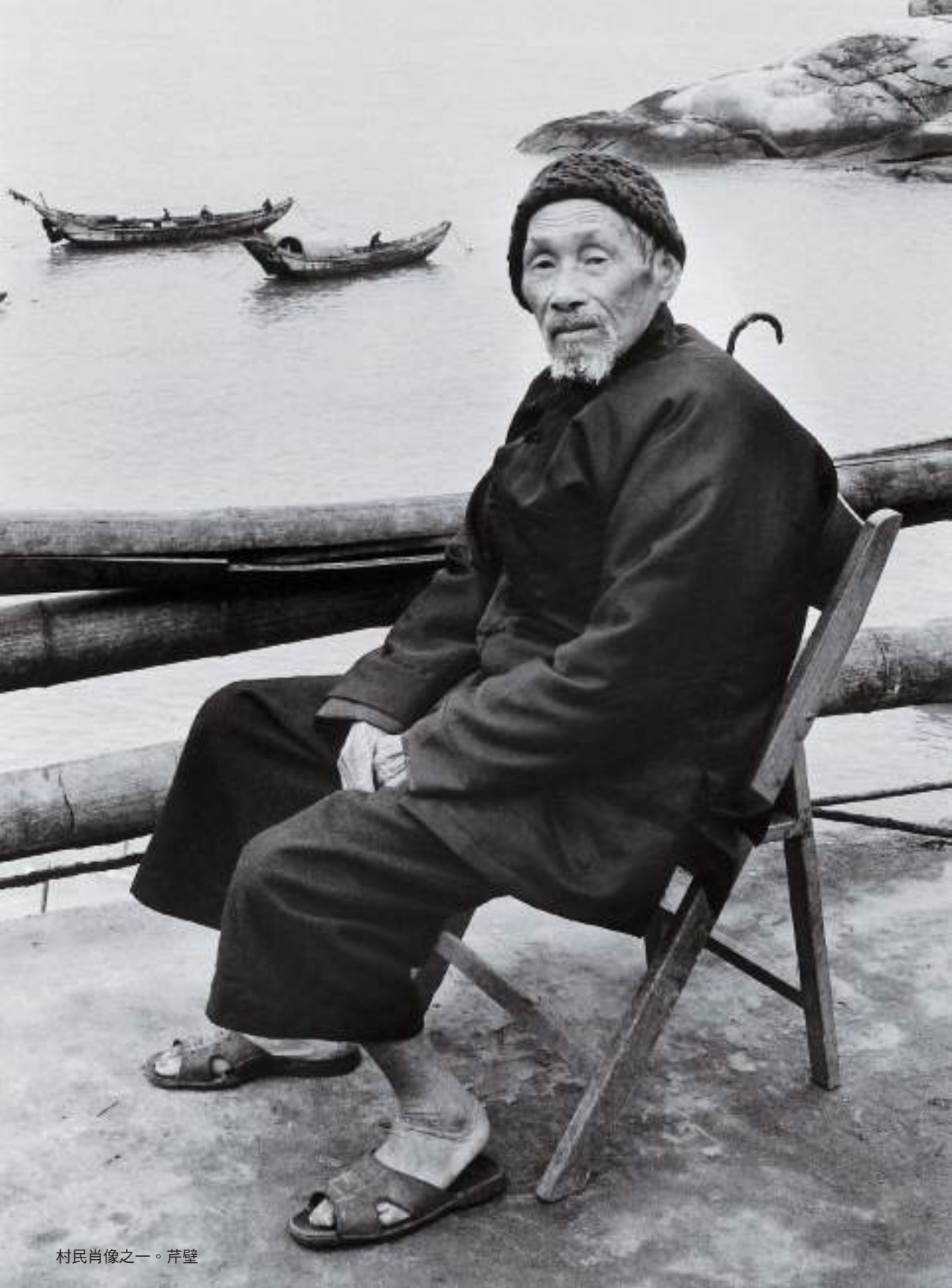
村民肖像之一。芹壁