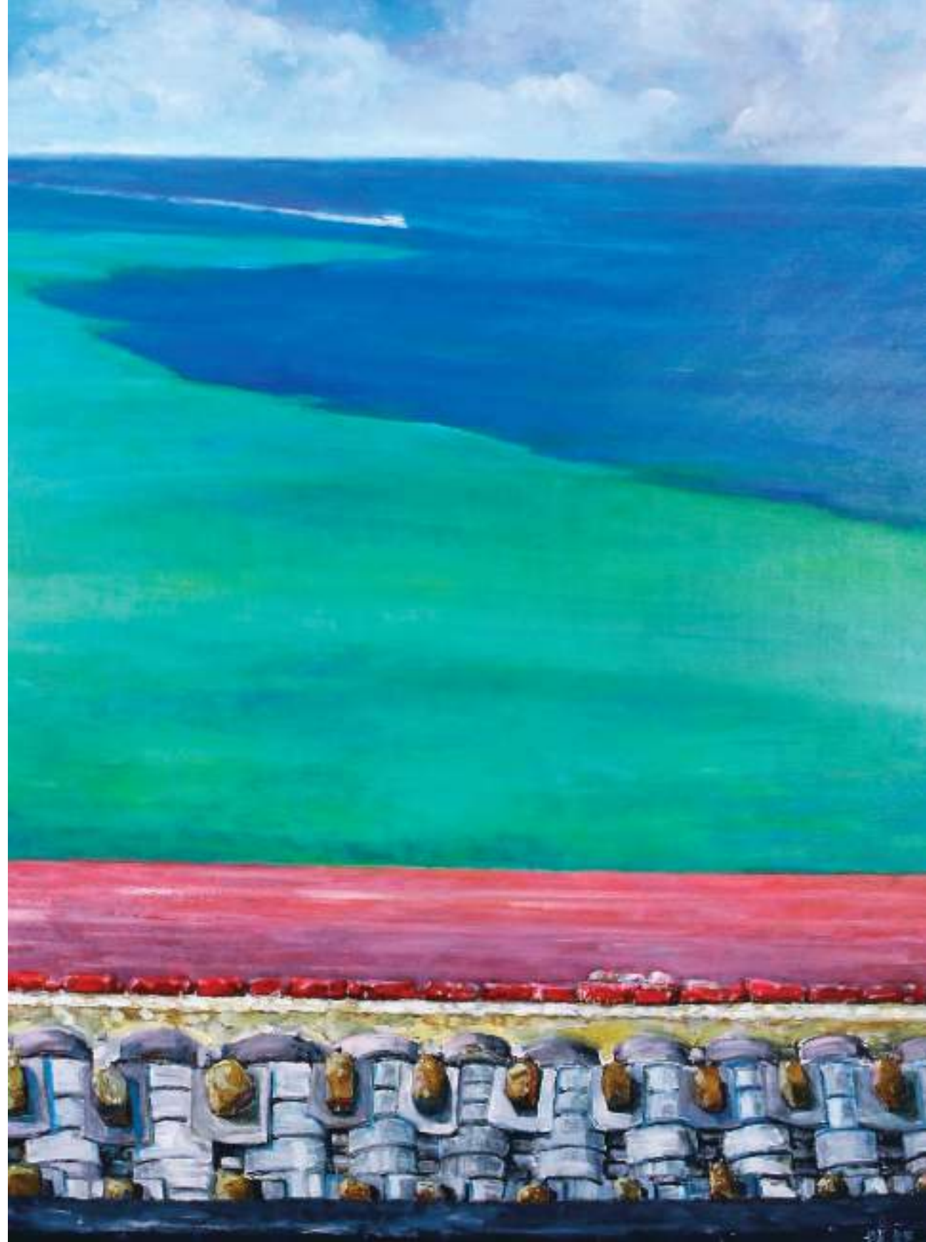
(右) 馬祖陰陽海，油彩，100×80cm，2012