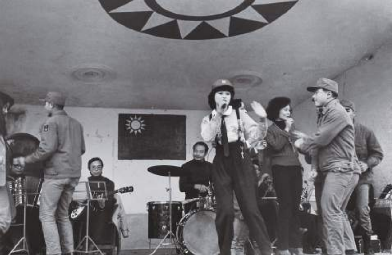
(上) 勞軍團員邀阿兵哥上台同樂。坂里國小