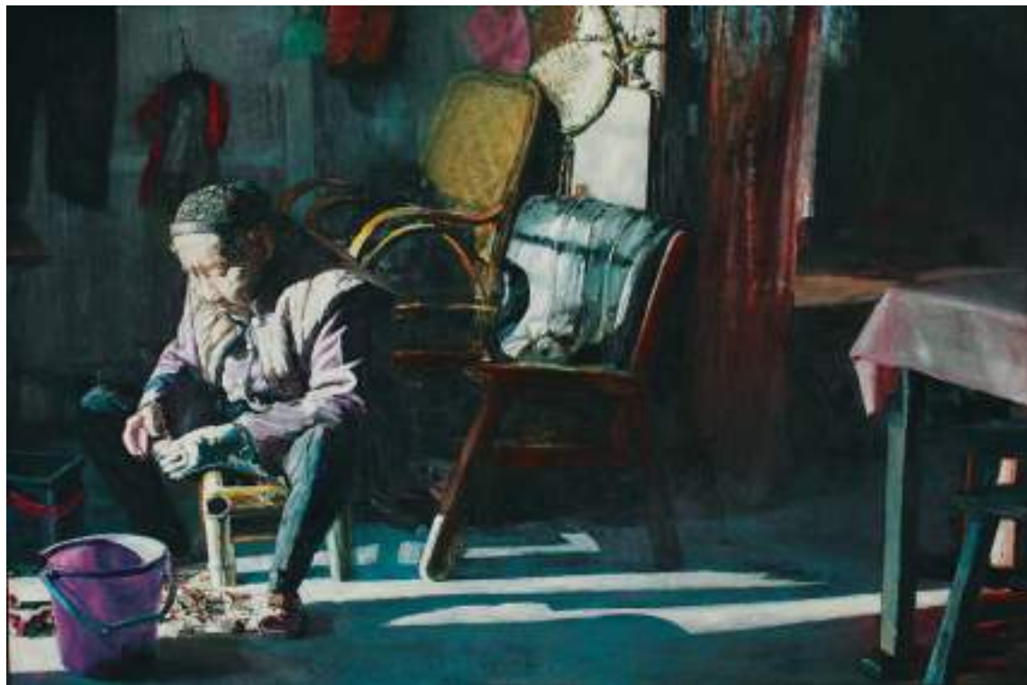
削蕃薯的依嬭，油彩，194×130.5cm，2015