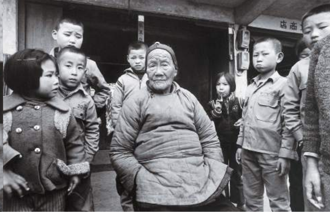
(上) 拍老奶奶時，孩子們一湧而上。津沙