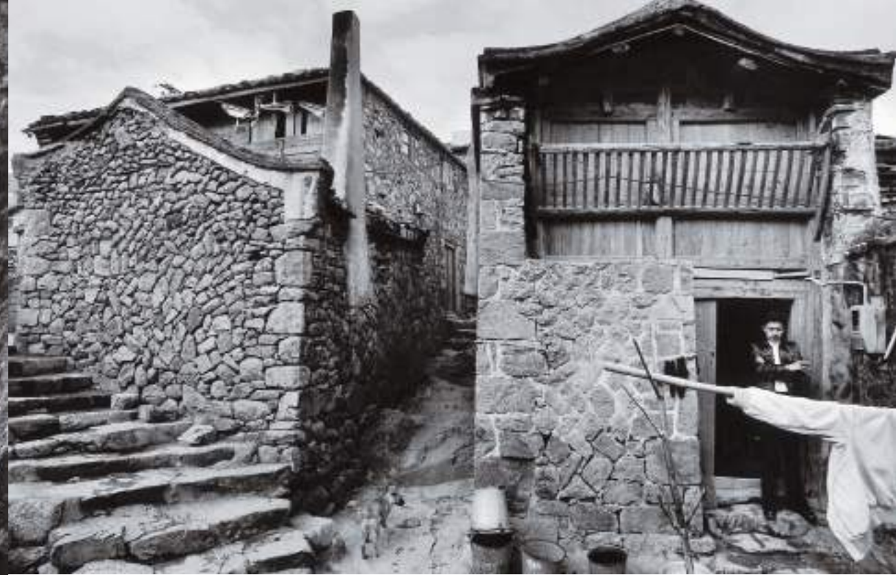
(上) 典型的閩東建築。復興