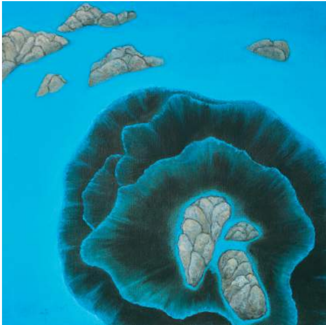
藍光幻想曲 I，油彩畫布，60×60cm，2015