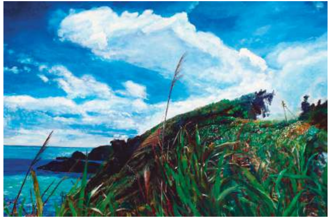
(上) 芒草與雲的對話，油彩，194×135.5cm，2011