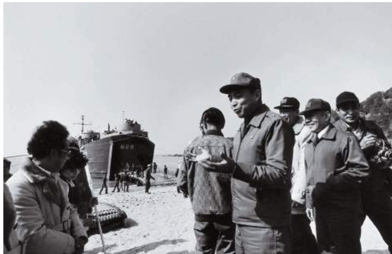
(下) 軍方代表前來迎接勞軍團成員。馬港