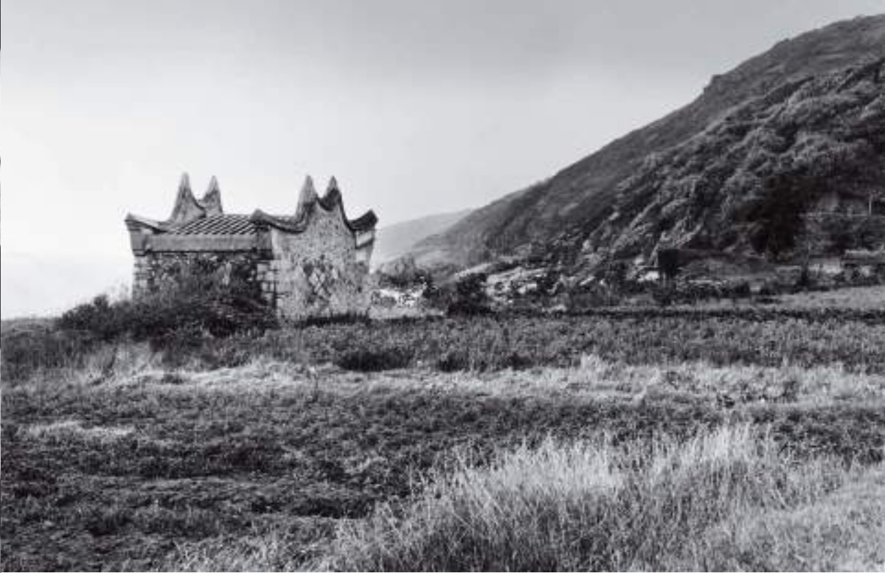
(上) 天后宮之一。坂里