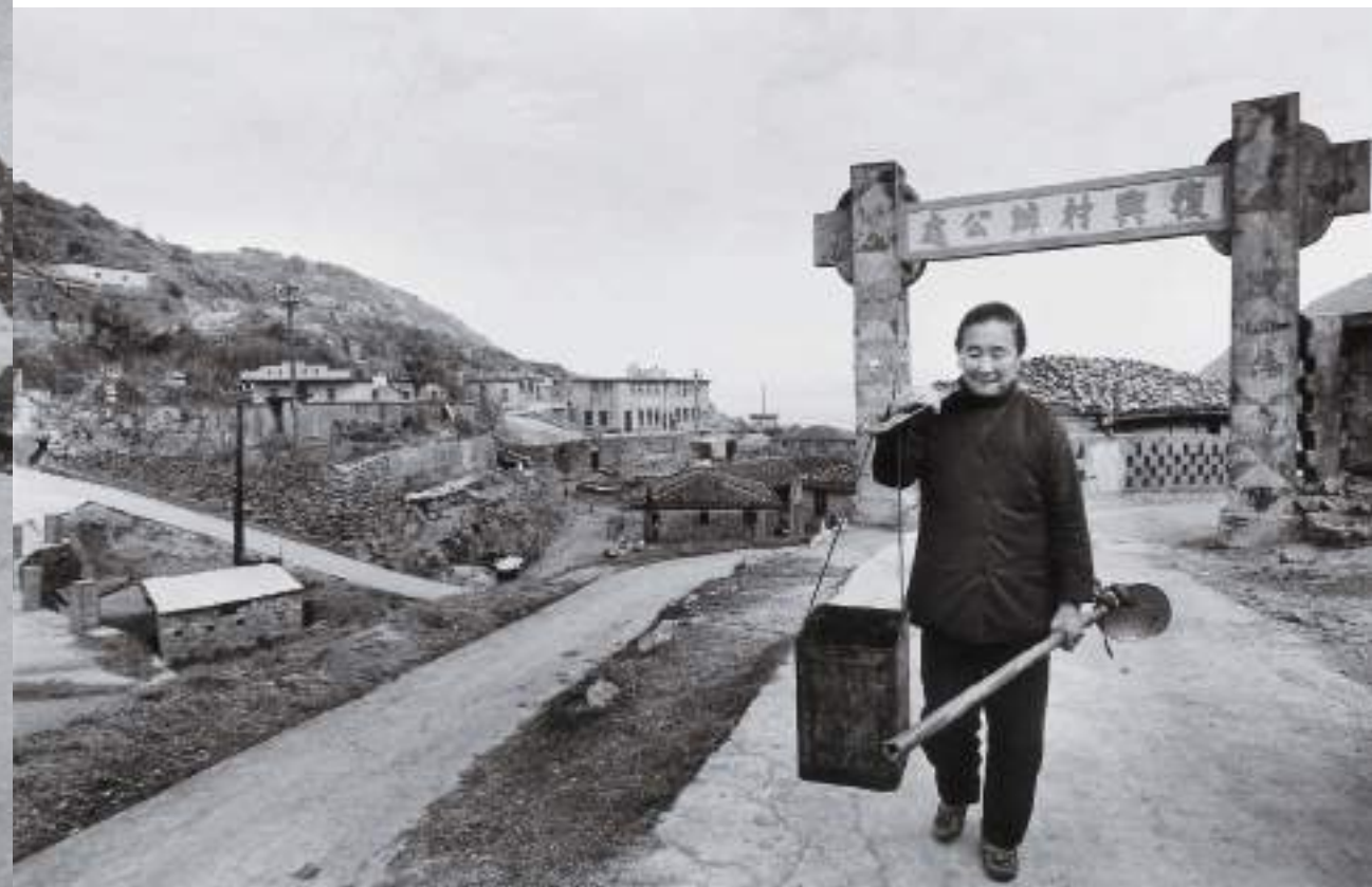
(下) 去酒廠撈免費的酒粕回家餵豬。復興