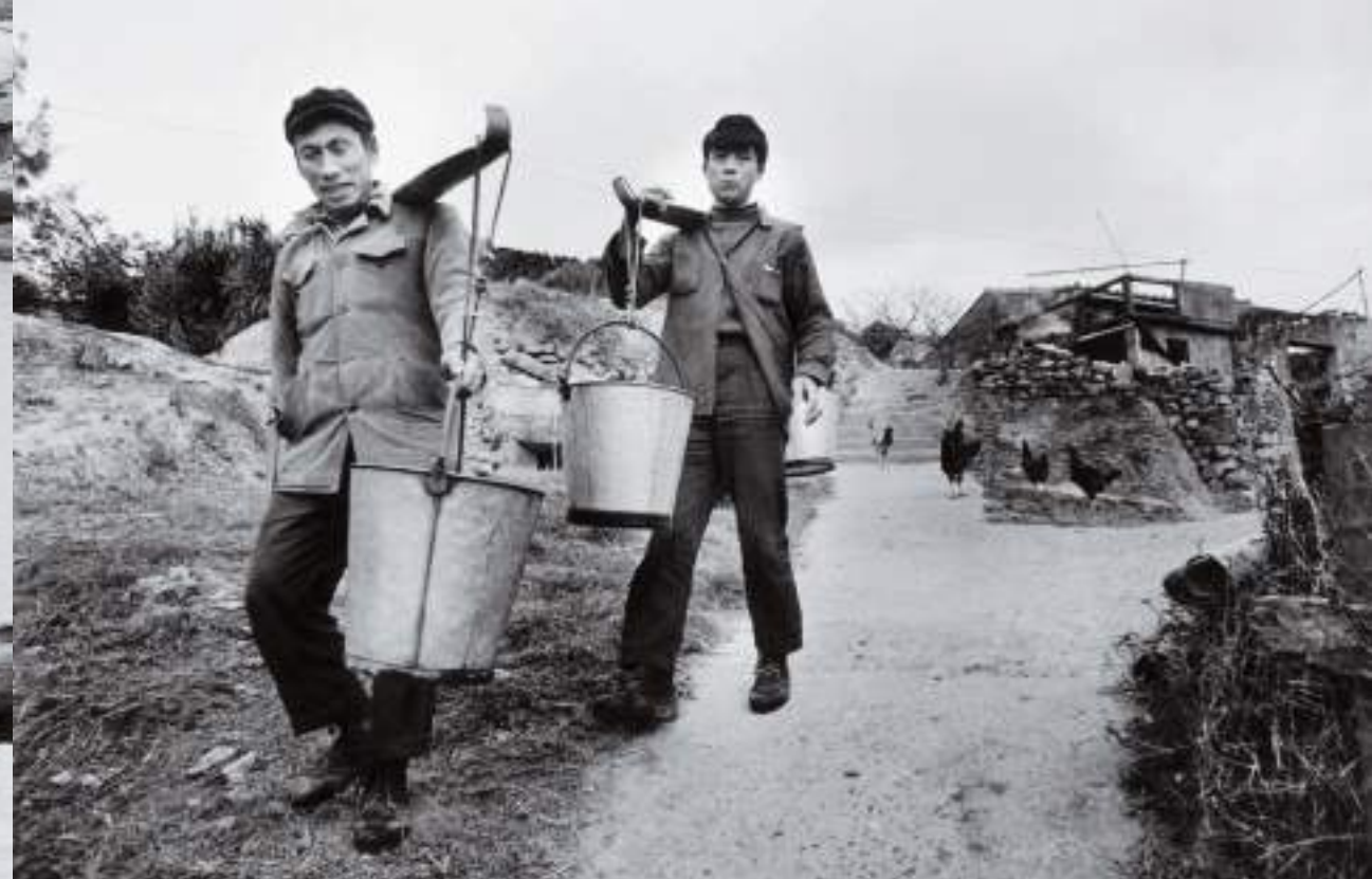
(上) 挑水的村民。田沃