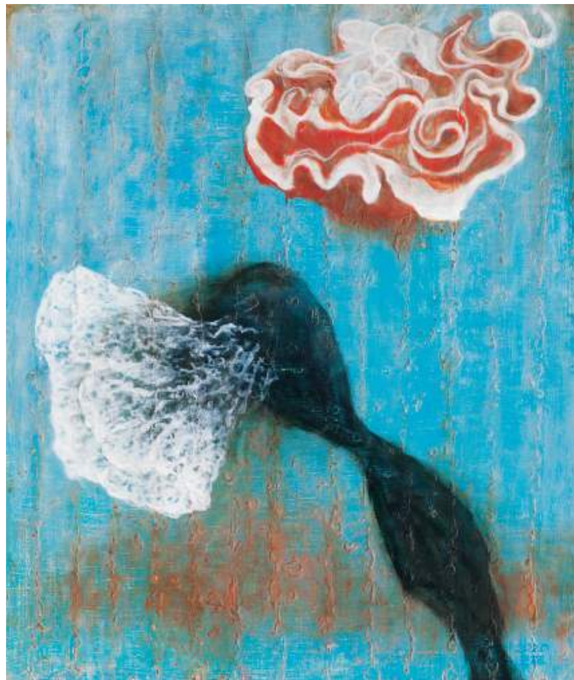
遺忘的港灣 I，油彩畫布，50×70cm，2021