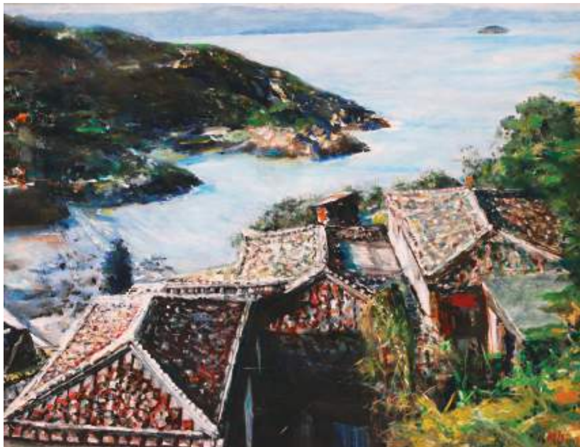
有石頭屋的牛角聚落，油彩，116×91cm，2011