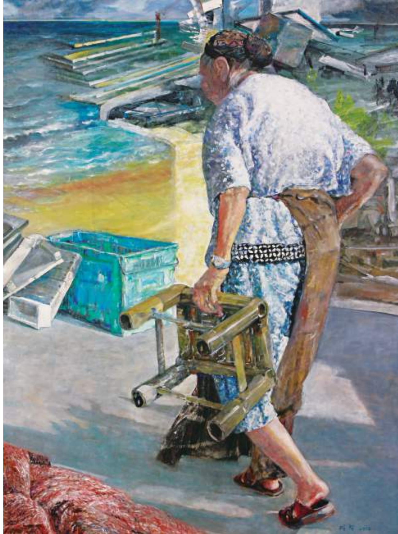
依嬭的生計歲月，油彩，194×130.5cm，2015（右）