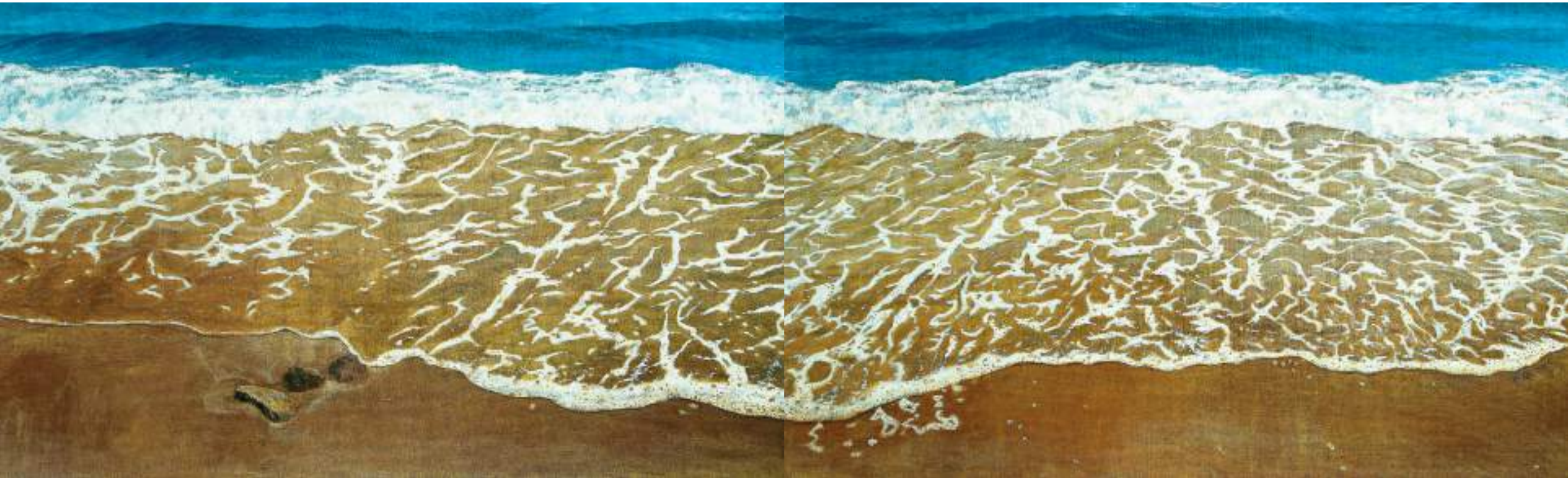
因為海洋的緣故，油彩畫布，324×97cm×2，2010