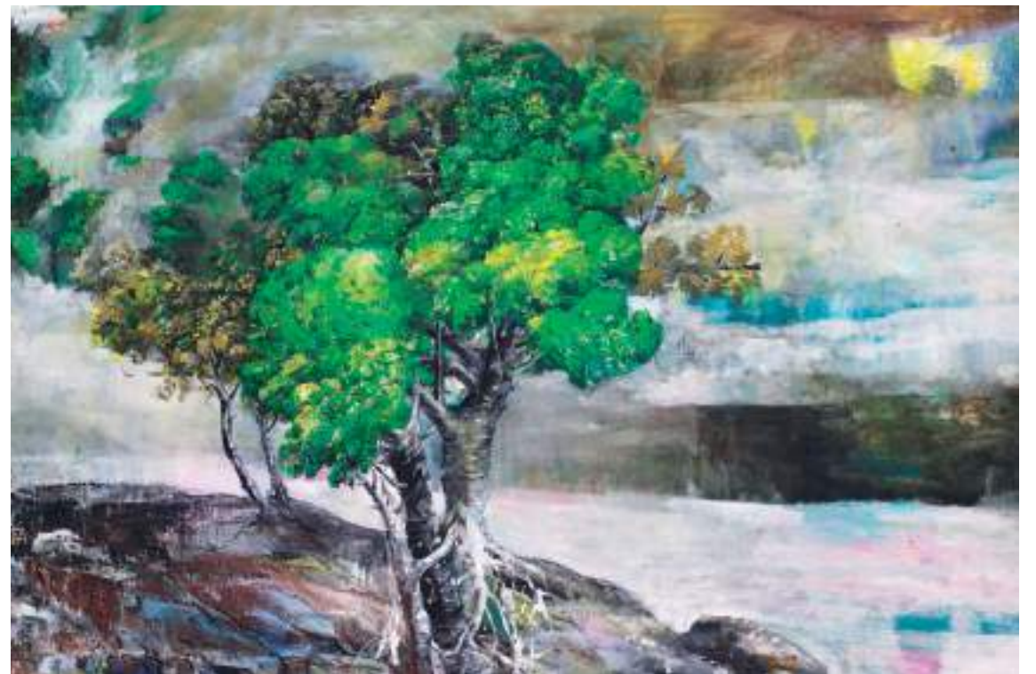
(左) 東引燈塔 II，油彩，53×72cm，2015