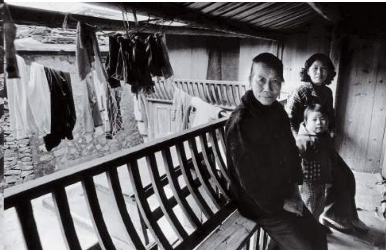
(下) 美人靠上話家常。復興