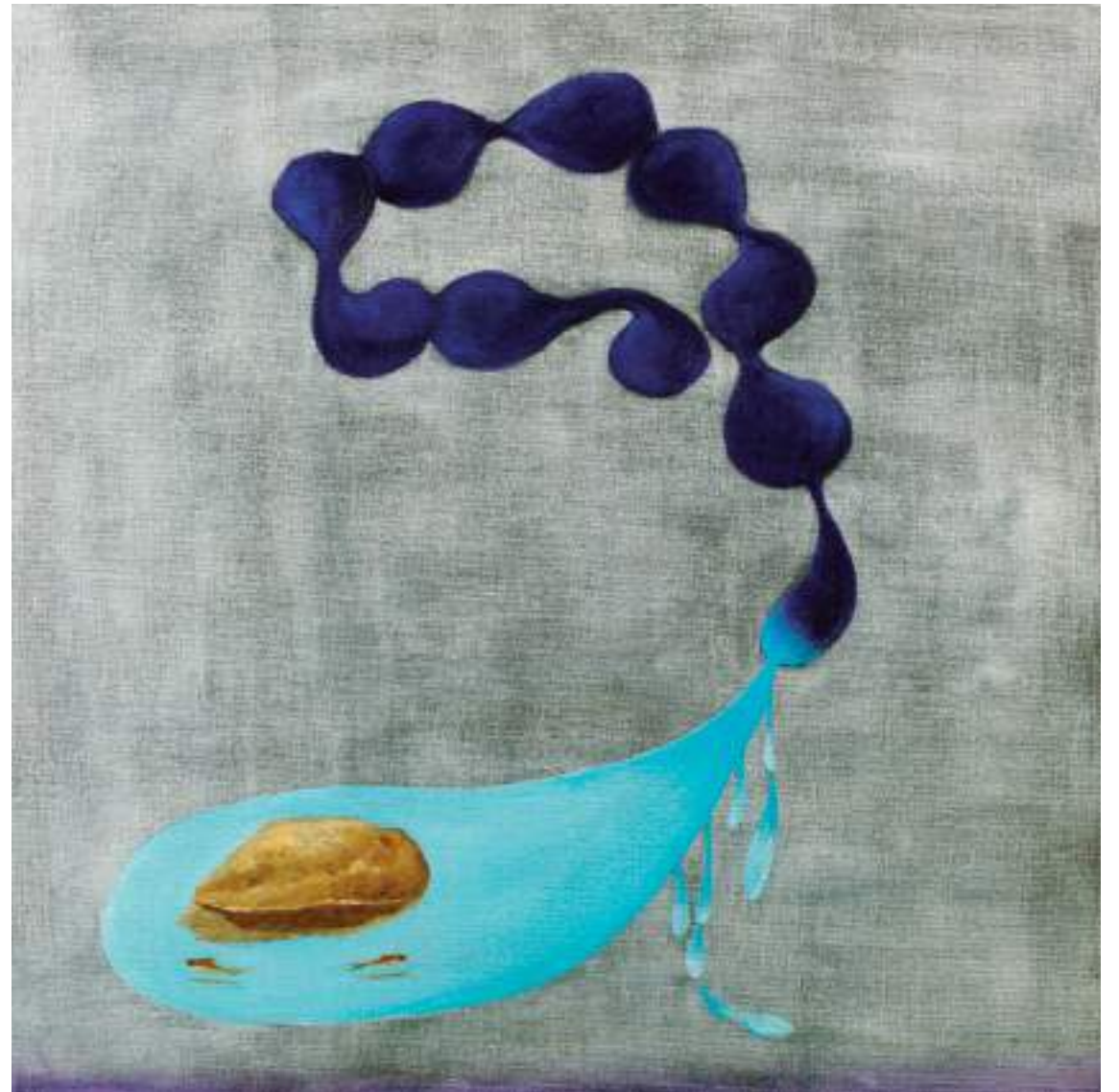
紫色眼淚，油彩畫布，60×60cm，2015