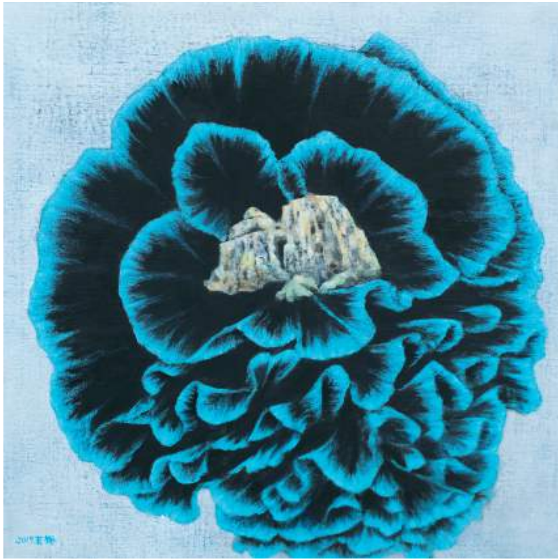
皺摺裡的藍調，油彩畫布 60×60cm，2019