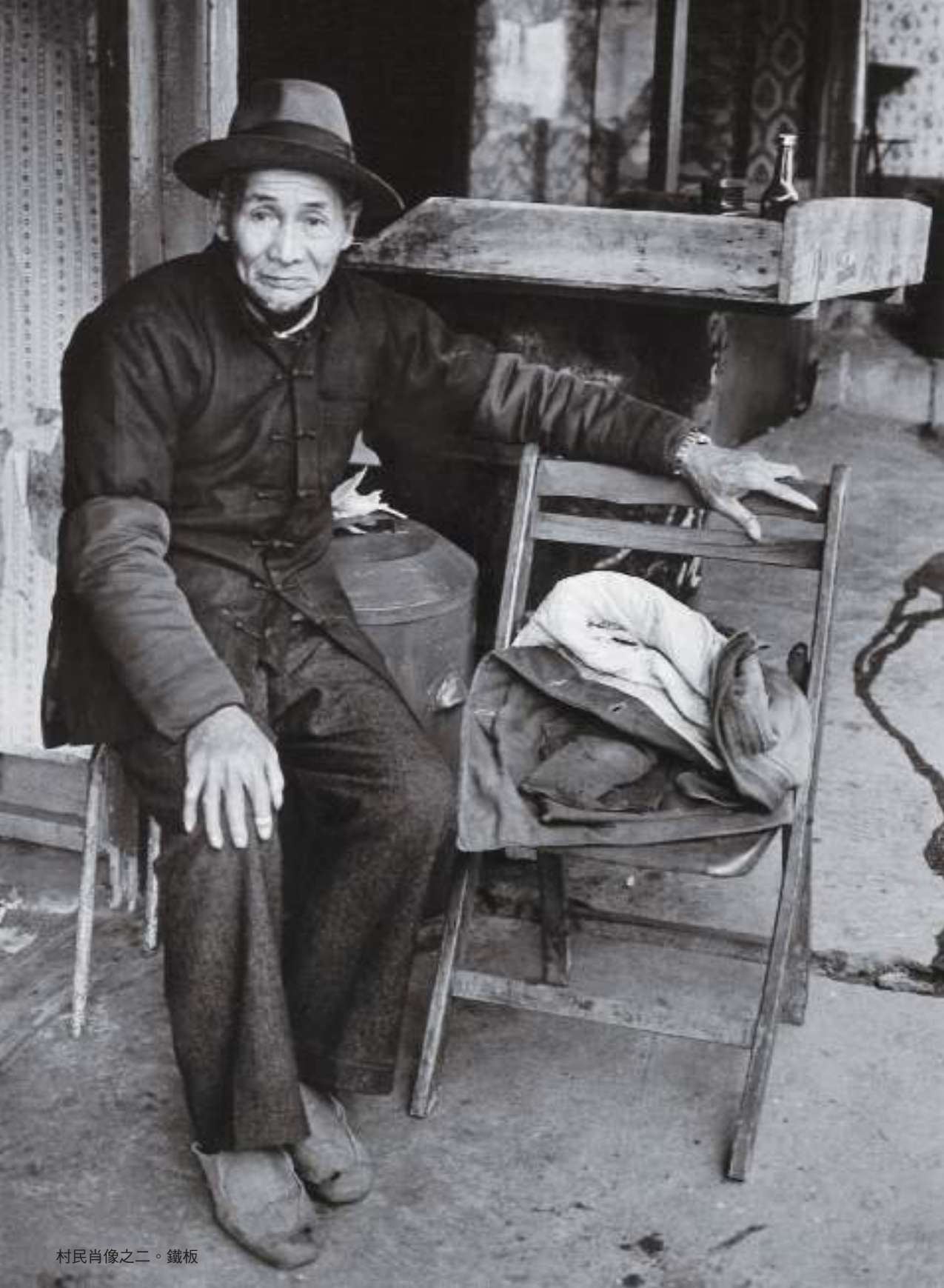
村民肖像之二。鐵板