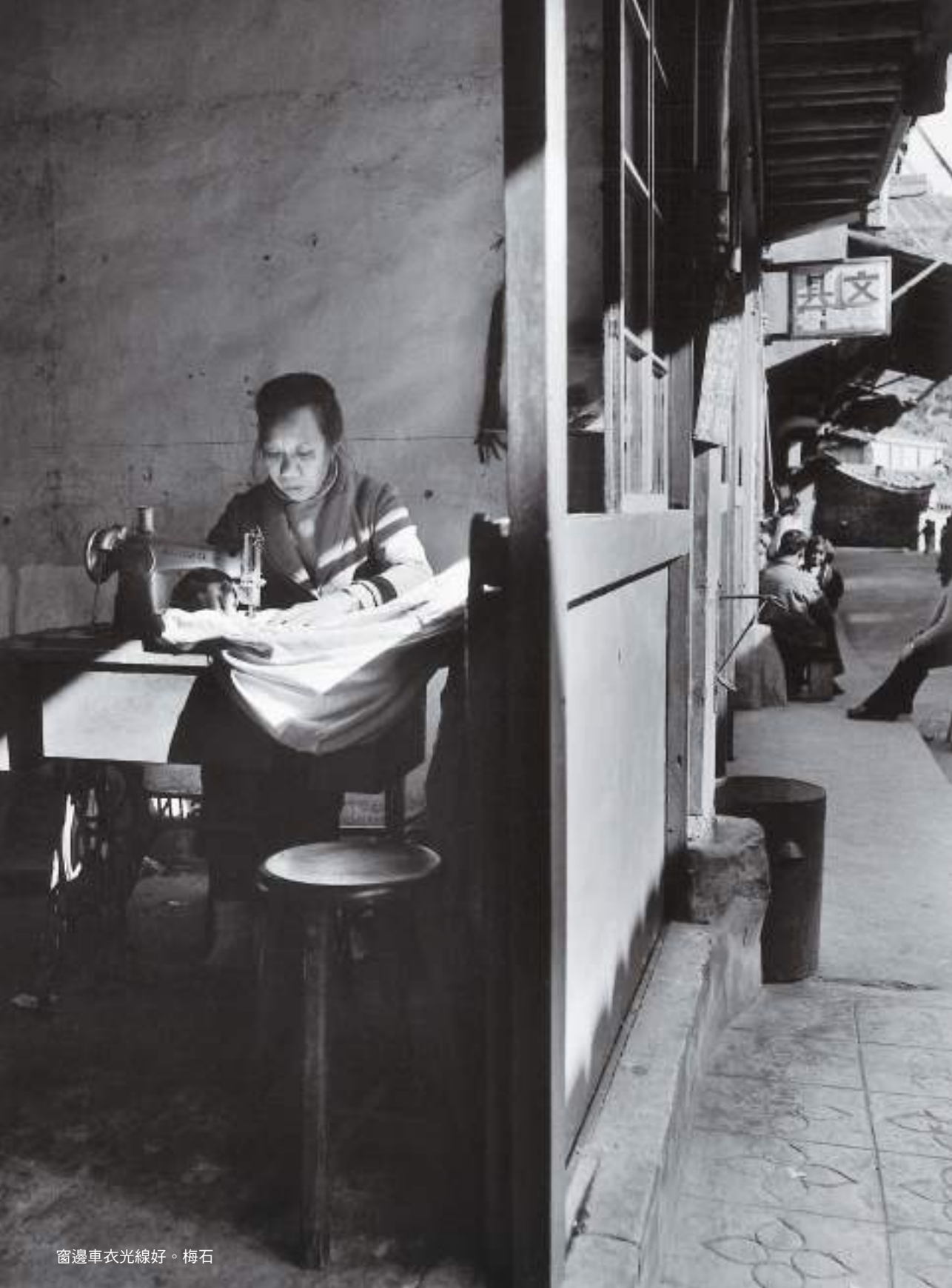
窗邊車衣光線好。梅石